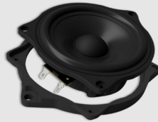
Mit Adapterrahmen unten bottom-mounted frame

Dichtringe benutzen – weicher Ring oben, fester Ring unten. Der feste Dichtring erlaubt eine Kabeldurchführung zwischen Lautsprecher und Tür. Der weiche Dichtring verbindet mit der Türverkleidung.