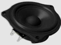
Ohne Adapterrahmen without mounting frame